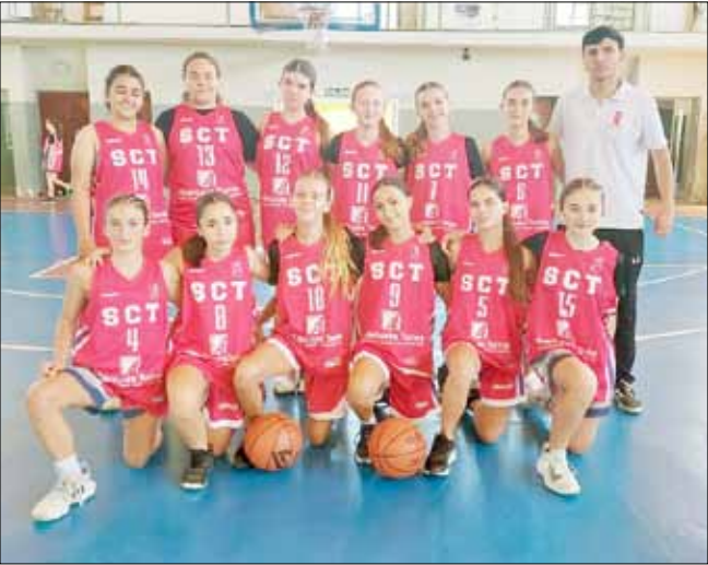
Categoría U15 de Sport Club.