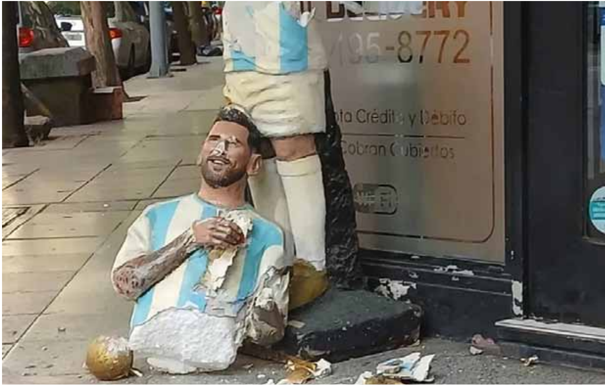
La estatua de Messi partida a la mitad. Así no se trata a un ídolo.

La estatua de Lionel Messi, en pleno centro marplatense, fue destruida. Es la tercera vez que se ensañan con la obra del artista Rodolfo Bayón.