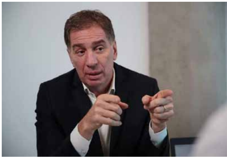
El ministro del Interior, Diego Santilli.

En la agenda de Santilli figuran tres ejes centrales: la situación fiscal de las provincias, el estado de las obras públicas y el avance de los proyectos de ley que el Ejecutivo busca sacar en el Congreso